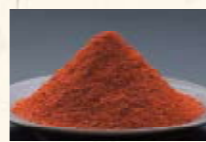
京都老舗の香辛料